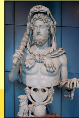
Commode en Hercule

Règne désastreux: autocratie, cruauté, débauche