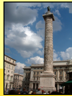
Colonne Marc- Aurèle. Rome 176-192