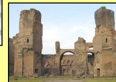
Thermes de Caracalla 216 Rome

Geta assassiné par Caracalla, tyran impopulaire; massacres civils (Alexandrie, Ctésiphon)